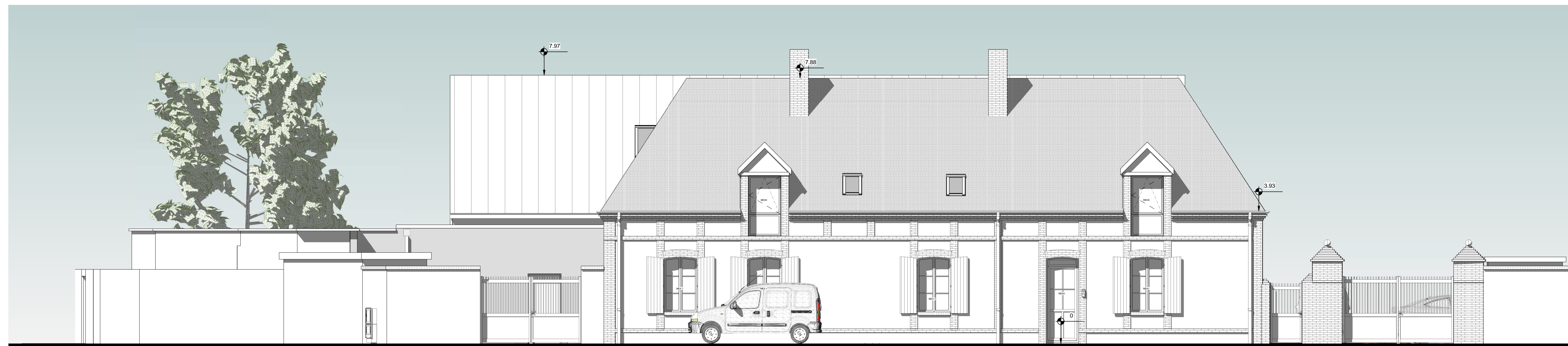
1 FACADE SUR RUE Ech : 1 : 50