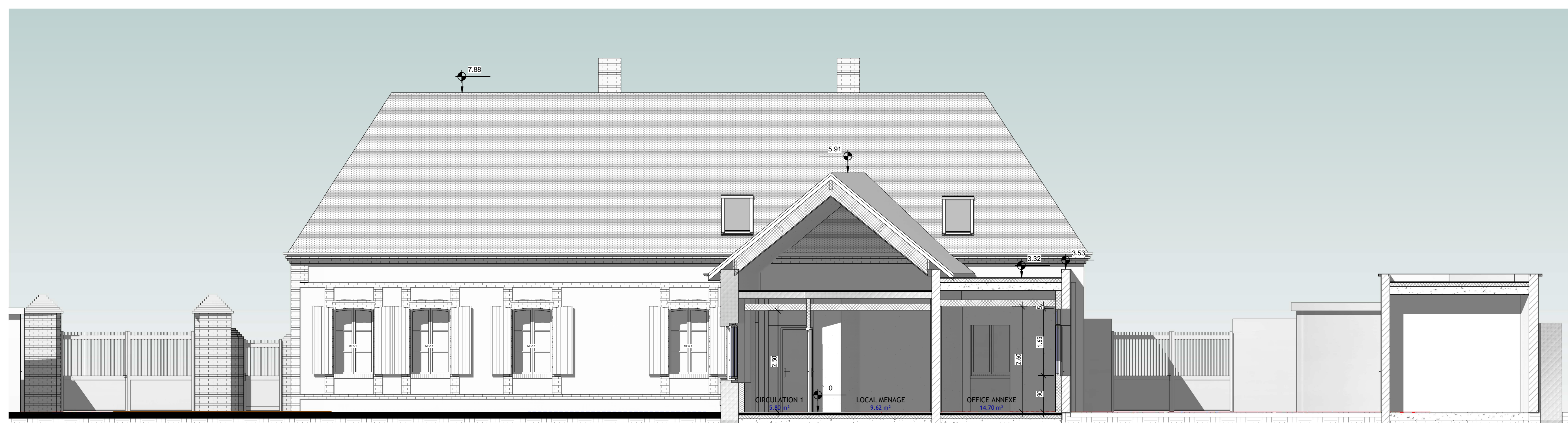
6 FACADE COUR BATIMENT ANCIEN Ech : 1 : 50