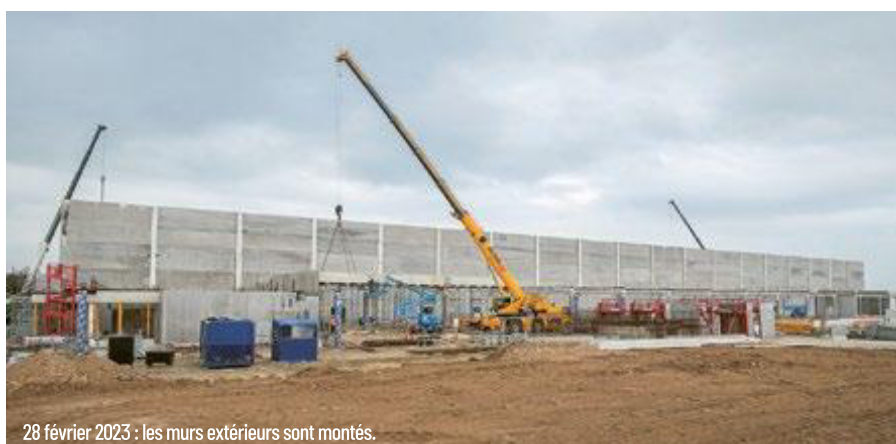
28 février 2023 : les murs extérieurs sont montés.

KD : La simplicité du nom, l'évocation de l'activité : congrès, salons et expositions, et la facilité d'utilisation du nom sont les maîtres mots. Ces critères respectés, nous sommes confiants dans la créativité et l'inspiration de nos concitoyens. À vous de jouer !