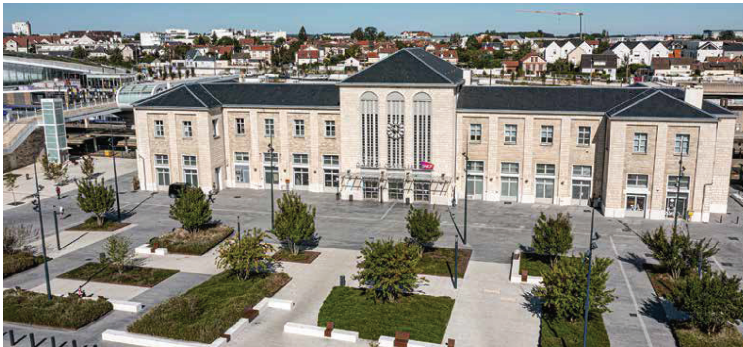
Le projet Pôle Gare entre dans sa phase finale.