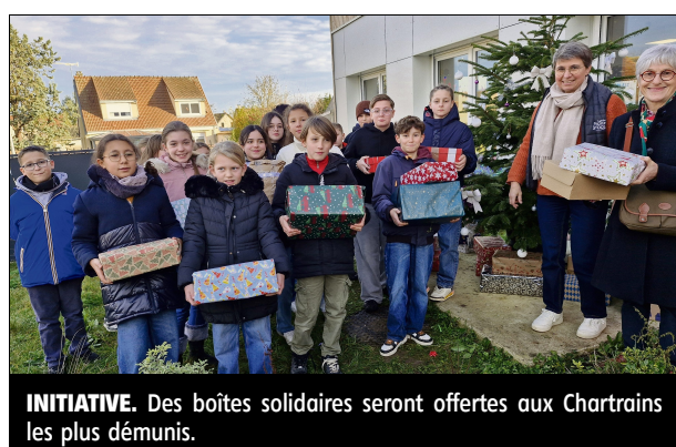
INITIATIVE. Des boîtes solidaires seront offertes aux Chartrains les plus démunis.